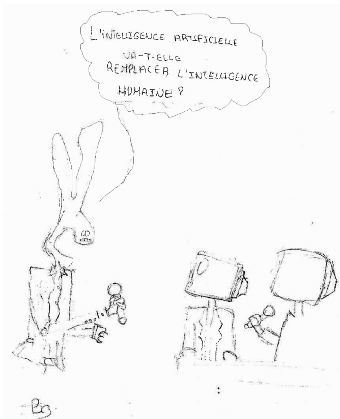
L'IA et Nous, un dossier illustré par Coline

Et si ton prof de maths était remplacé par une intelligence artificielle ? Et si ton téléphone savait déjà ce que tu allais lui demander avant même que tu ne l'allumes ?